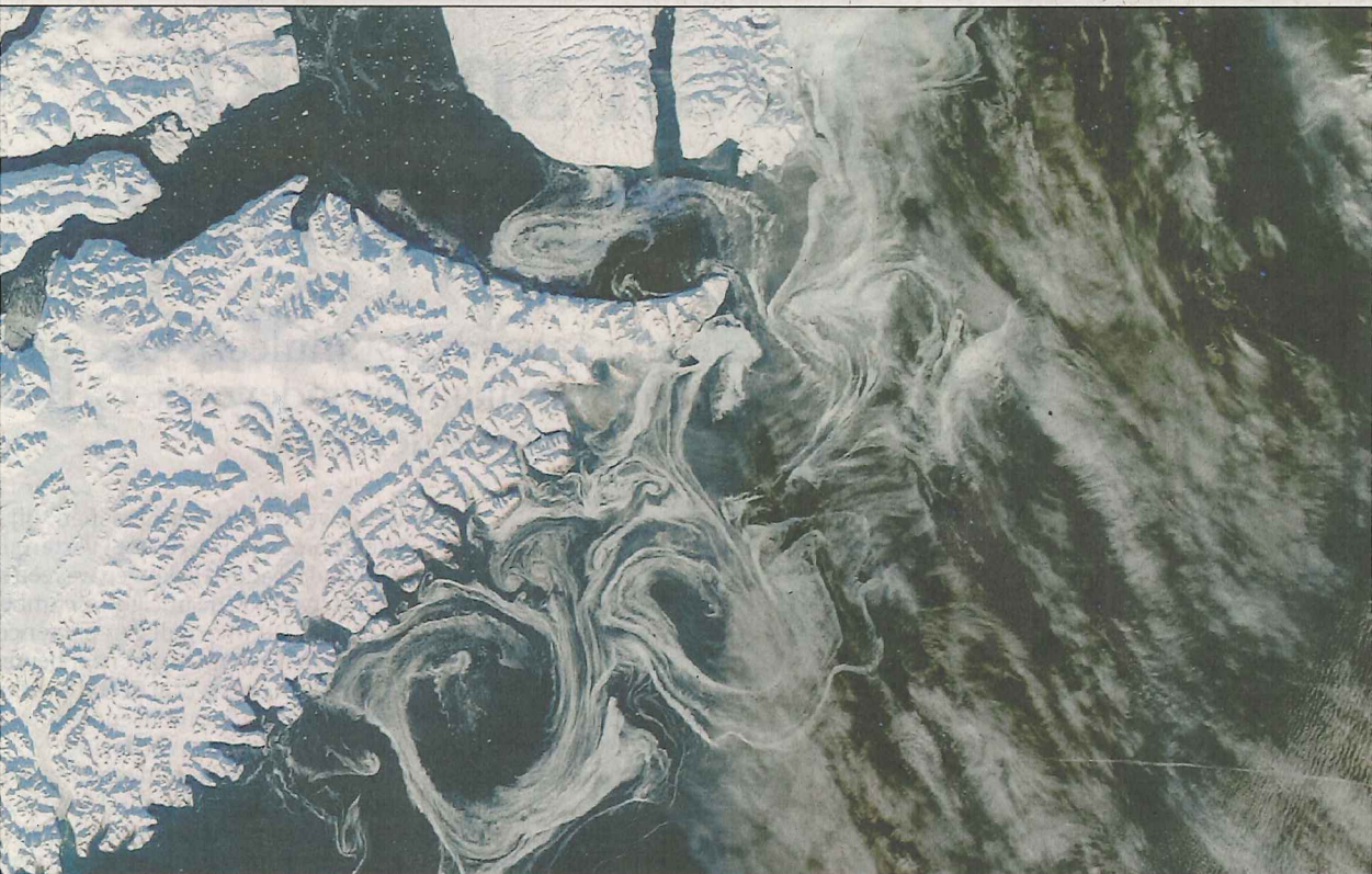
Ijskap van Groenland, zoals waargenomen door een NASA-satelliet.